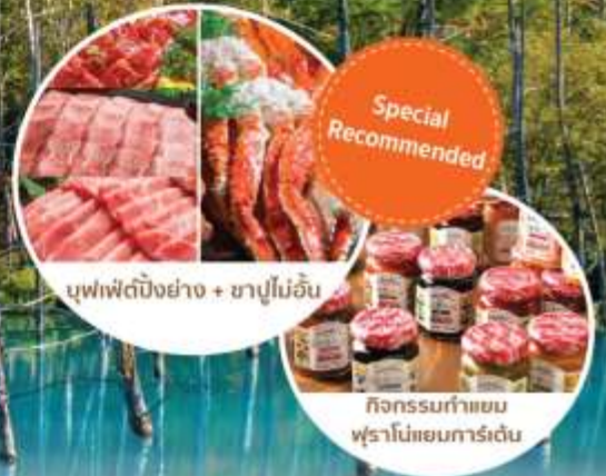
บุฟเฟ่ต์บิงย่าง + ซาปูไม่อื่น