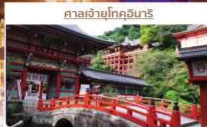
ศาลเจ้ายูโกคุอินาริ