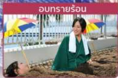
อบทรายร้อน