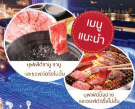
เมนูแนะนำ